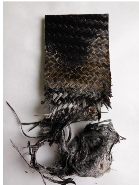
Panneau après traitement en fin de vie

Ces exemples de composites recyclables sont non exhaustifs. VESO propose également des solutions sur-mesure en fonction de vos applications.